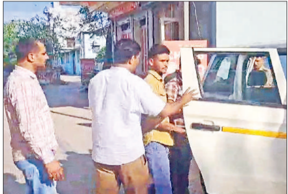
रेवाड़ी। आरोपियों को गाड़ी में बैठाते हुए पुलिस।