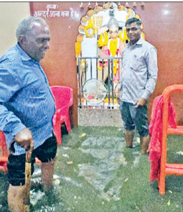
रेवाड़ी। गत 18 मार्च को हनुमान मंदिर में भरे गंदे पानी का फाइल फोटो।

शहर के प्राचीन बड़ा तालाब हनुमान मंदिर में सीवरज पानी भरने की समस्या को लेकर वकीलों ने नाराजगी जताते हुए विभाग के खिलाफ कार्रवाई मांग की है। अधिवक्ताओं ने इसे धार्मिक भावना आहत करने का मामला बताया है। गत 18 मार्च को तेज बरसात आने पर मंदिर परिसर में सीवर का पानी भर गया था, जिससे श्रद्धालुओं को परेशानी उठानी पड़ी। पुलिस अधीक्षक को दी गई शिकायत में अधिवक्ताओं ने कहा कि इस मामले में किसी भी विभागीय अधिकारी व