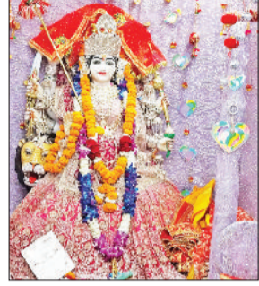
रेवाड़ी। अष्टमी पर दुर्गा माता मंदिर में सजी माता की प्रतिमा तथा रेवाड़ी। अष्टमी पर मंदिर में माता का गुणगान करती महिलाएं।

रोमा यात्रा मोती चौक, गोकल गेट, रेलवे रोड, सरकुलर रोड व जीवली बाजार होते हुए दुर्गा मंदिर में हुई सप्तपन्न, श्रद्धालुओं में दिखा जबरदस्त उत्साह हरिभूमि न्यूज >>> रेवाड़ी