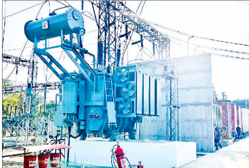
रेवाड़ी। कोसली पावर सब स्टेशन में स्थापित किया गया ट्रांसफार्मर।

कटों से राहत मिलेगी। अभी तक सब स्टेशन में अलग-अलग कैपेसिटी के 3 पावर ट्रांसफार्मर लगे हुए थे। इनकी कुल कैपेसिटी 95 एमवीए थी। उपभोक्ताओं की संख्या और लोड बढ़ने के कारण सब स्टेशन ओवरलोड की स्थिति का सामना कर रहा था। खासकर गर्मी के सीजन में लोड बढ़ने से ट्रांसफार्मर डैमेज होने की आशंका बनी रहती थी। ओवरलोडिंग की सूरत में कोसली व आसपास के गांवों के उपभोक्ताओं को अनावश्यक पावर कटों का सामना भी करना पड़ रहा था। समस्या से निजात दिलाने के लिए एचवीपीएन ने 20 एमवीए क्षमता का एक और ट्रांसफार्मर लगाने का निर्णय लिया था। निगम मुख्यालय से अनुमति मिलने के बाद गत दिनों नया ट्रांसफार्मर लगाने की प्रक्रिया शुरू की गई थी। बाहर से ट्रांसफार्मर की खरीद करने के बाद इसे कुशलतापूर्वक चालू कर दिया गया। इससे सब स्टेशन का लोड बढ़कर 115 एमवीए हो गया है।