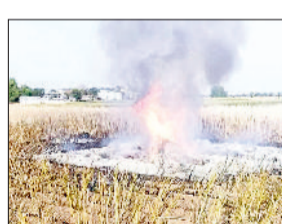
जलकर राख हो गई। इससे किसान को हजारों रुपये का नुकसान हुआ है। पुलिस आगजनी के कारणों की

जुड़ी गांव में बुधवार देर सांय आग लगने से एक किसान की लगभग डेढ़ एकड़ सरसों की फसल