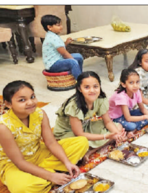
रेवाड़ी। अष्टमी पर अनाजमंडी में प्रसाद ग्रहण करती कंजिकाएं।

आज होगी मां सिद्धिदात्री की उपासना शुक्रवार को अंतिम नवरात्रे पर उपासक मां दुर्गा की 9वीं शक्ति सिद्धिदात्री देवी की पूरे विधि-विधान से पूजा करेंगे। धार्मिक ग्रंथों में उल्लेख है कि मां सभी प्रकार की सिद्धियों को देने वाली हैं। अणिमा, महिमा, गरिमा, लधिमा, प्राप्ति, प्राकाम्या, रूशित्व और वशित्व 8 सिद्धियां होती हैं। मां सिद्धिदात्री भक्तों को यह सभी सिद्धियां प्रदान करने में समर्थ हैं। देवी पुराण के अनुसार भगवान शिव ने इनकी कृपा से ही इन सिद्धियों को प्राप्त किया था, मां की अनुकंपा से ही भगवान शिव का आधा शरीर देवी का हो गया था। इसी कारण वह लोक में अर्धनारीश्वर के नाम से प्रसिद्ध हुए।