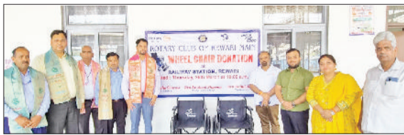
रेवाड़ी। रेलवे को व्हील चेयर डोनेट करते हुए क्लब के सदस्य।