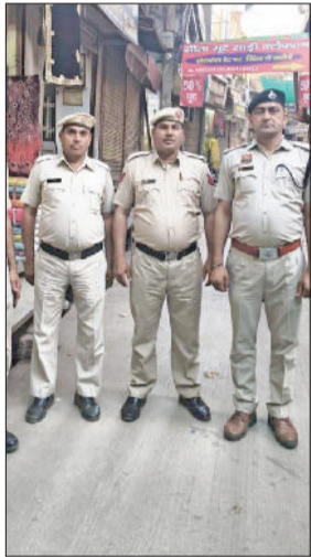
नारनौल। बाजार में गश्त के दौरान पुलिस।