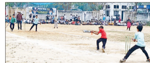
रेवाड़ी। क्रिकेट प्रतियोगिता में खेलते हुए खिलाड़ी।

कोसली। गांव गुर्जरवास स्थित न्यू एरा पब्लिक स्कूल में आयोजित तीन दिवसीय अंडर-15 क्रिकेट टूर्नामेंट का समापन हो गया। प्रतियोगिता में नेहरूगढ़ जूनियर्स, न्यू एरा पब्लिक स्कूल गुर्जरवास, कोसली स्टेशन, सुरेहली, कोसली गांव, बच्चा, रामगढ़, लुखी, नाहड़, श्यामनगर, सूमा खेड़ा, भुरथला, झाल, जुड़ी व बिसोहा सहित विभिन्न गांवों की 31 टीमों ने भाग लिया। टूर्नामेंट के ओपनिंग मैच में गामड़ी जूनियर्स ने लुखी की टीम को 88 रनों से हराकर जीत दर्ज की। इसके बाद न्यू एरा पब्लिक स्कूल की टीम ने कोहारड़ को हराया। क्वार्टर फाइनल मुकाबलों में लुखी ने 32 रनों से जीत हासिल की, वहीं बिसोहा ने कोसली को 8 विकेट से पराजित किया। न्यू एरा पब्लिक स्कूल गुर्जरवास की टीम ने सूमा खेड़ा को 18 रनों से हराकर सेमीफाइनल में प्रवेश किया। सेमीफाइनल में न्यू एरा टीम ने लुखी को 8 विकेट से हराया, जबकि सुरेहली की टीम ने भी बेहतरीन खेल दिखाते हुए फाइनल में प्रवेश किया। फाइनल