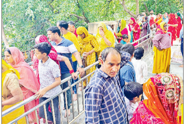
रेवाड़ी। कोसली के देवी मंदिर में लगी श्रद्धालुओं की कतार।

रेवाड़ी पर परिवर्तित मार्ग रेवाड़ी-रींगस-फुलेरा होकर संचालित होगी। गाड़ी संख्या 20937 पोखंडर-दिल्ली सराय रेलसेवा 9 मई को पोखंडर से प्रस्थान करके अपने निर्धारित मार्ग फुलेरा-जयपुर-अलवर-रेवाड़ी के स्थान पर परिवर्तित मार्ग फुलेरा-रींगस-रेवाड़ी होकर संचालित होगी। गाड़ी संख्या 20482 दिल्ली कैंट-जोधपुर वंदे भारत रेलसेवा 10 मई को दिल्ली कैंट से प्रस्थान करके अपने निर्धारित मार्ग रेवाड़ी-अलवर-जयपुर-फुलेरा-डेगाना के स्थान पर परिवर्तित मार्ग रेवाड़ी-रींगस-जयपुर होकर संचालित होगी। गाड़ी संख्या 12916 दिल्ली-साबरमती रेलसेवा 10 मई को दिल्ली से प्रस्थान करके अपने निर्धारित मार्ग रेवाड़ी-अलवर-जयपुर-फुलेरा के स्थान पर परिवर्तित मार्ग रेवाड़ी-रींगस-फुलेरा होकर संचालित होगी। गाड़ी संख्या 15013 जैसलमेर-काठगोदाम रेलसेवा 10 मई को जैसलमेर से प्रस्थान करके अपने निर्धारित मार्ग जोधपुर-मारवाड-अजमेर-जयपुर-अलवर-रेवाड़ी के स्थान पर परिवर्तित मार्ग जोधपुर-डेगाना-रतनगढ़-लोहारू-रेवाड़ी होकर संचालित होगी। गाड़ी संख्या 20990 चंडीगढ़-उदयपुर सिटी रेलसेवा 10 मई को चंडीगढ़ से प्रस्थान करके अपने निर्धारित मार्ग रेवाड़ी-अलवर-जयपुर-फुलेरा के स्थान पर परिवर्तित मार्ग रेवाड़ी-रींगस-फुलेरा होकर संचालित होगी।