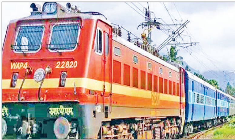
रेवाड़ी। रेवाड़ी रेलमार्ग से गुजरती एक्सप्रेस ट्रेन।