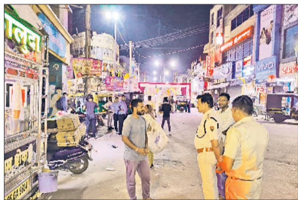
रेवाड़ी। गश्त के दौरान लोगों से संवाद करती पुलिस।